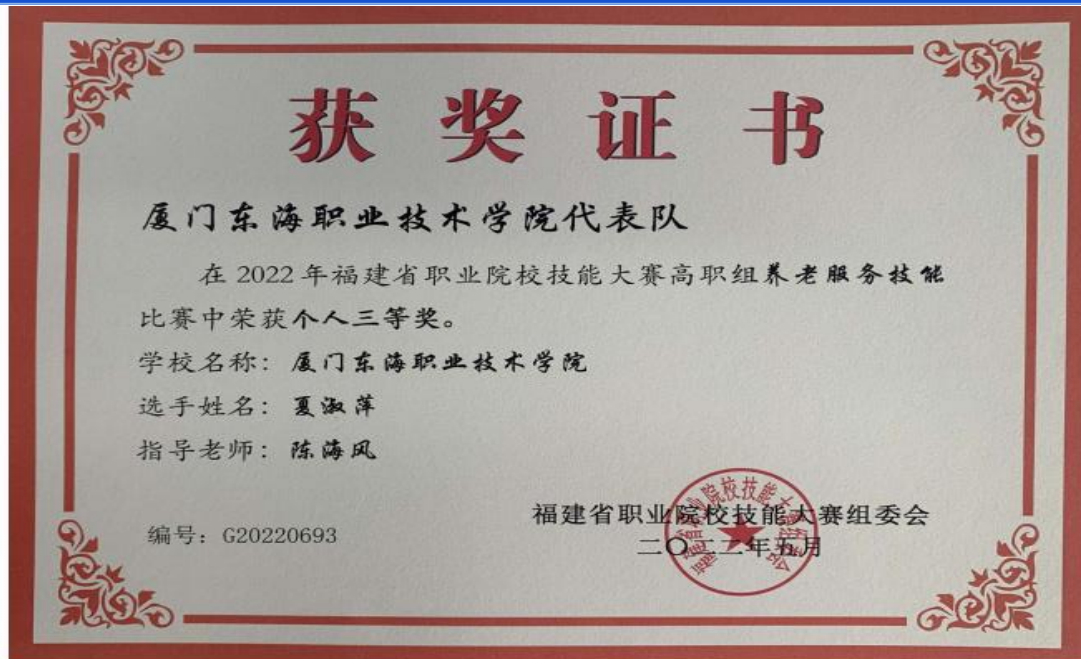
图 16：夏淑萍同学荣获 2022 年福建省技能大赛高职组养老服务技能个人三等奖