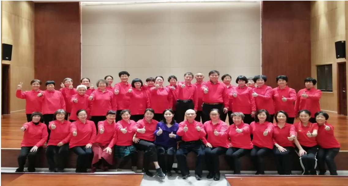
图 8：学校教师主动关爱老人，得到大家一致好评