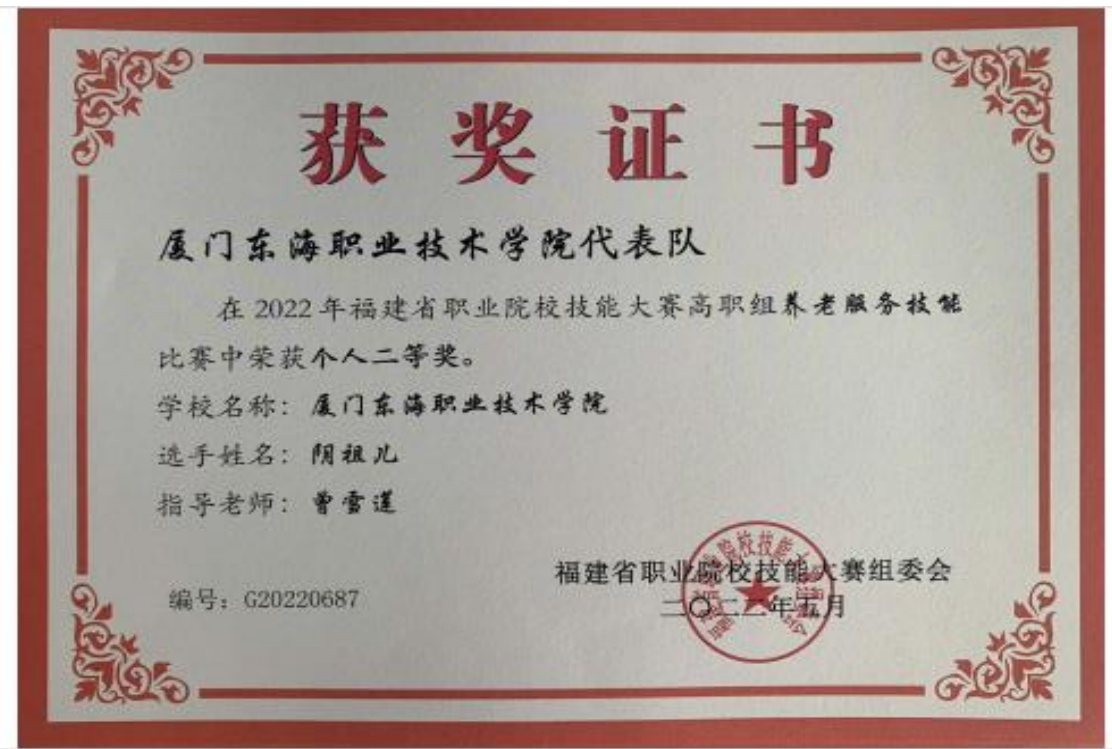
图 15：阴祖儿同学荣获 2022 年福建省技能大赛高职组养老服务技能个人二等奖