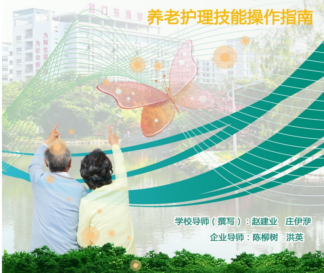
图 11：校企合作开发现代学徒制《老年护理及管理技能》教材