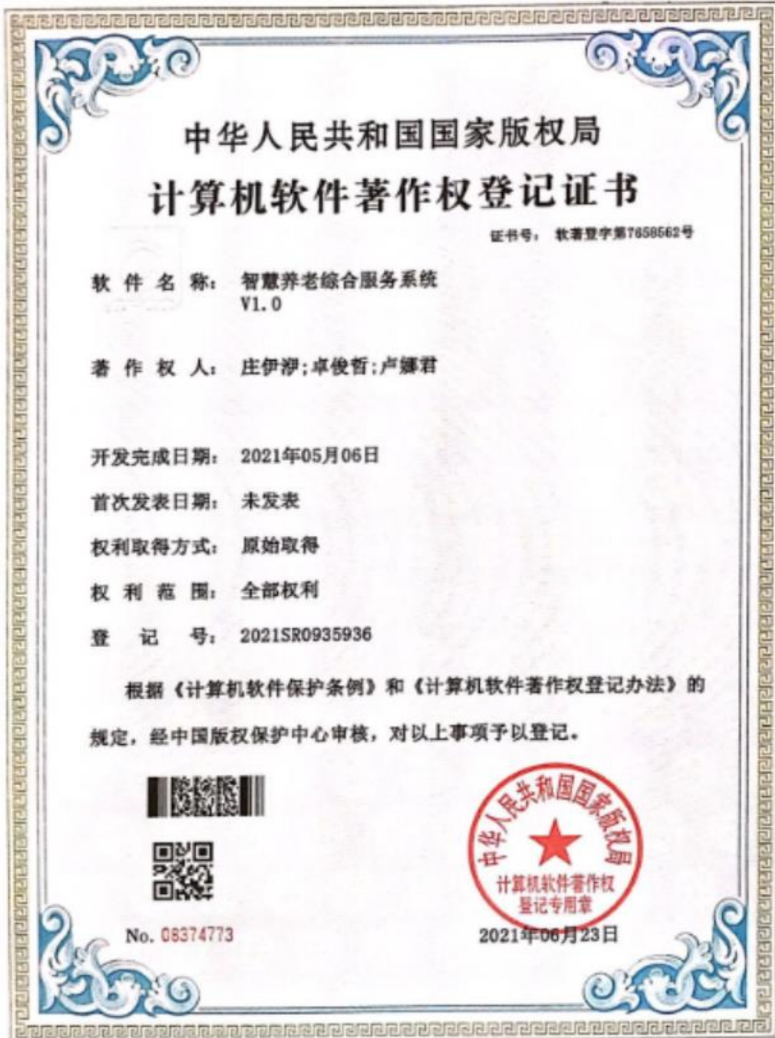
图 19：师生成功申报软件著作权《智慧养老综合服务系统 V1.0》