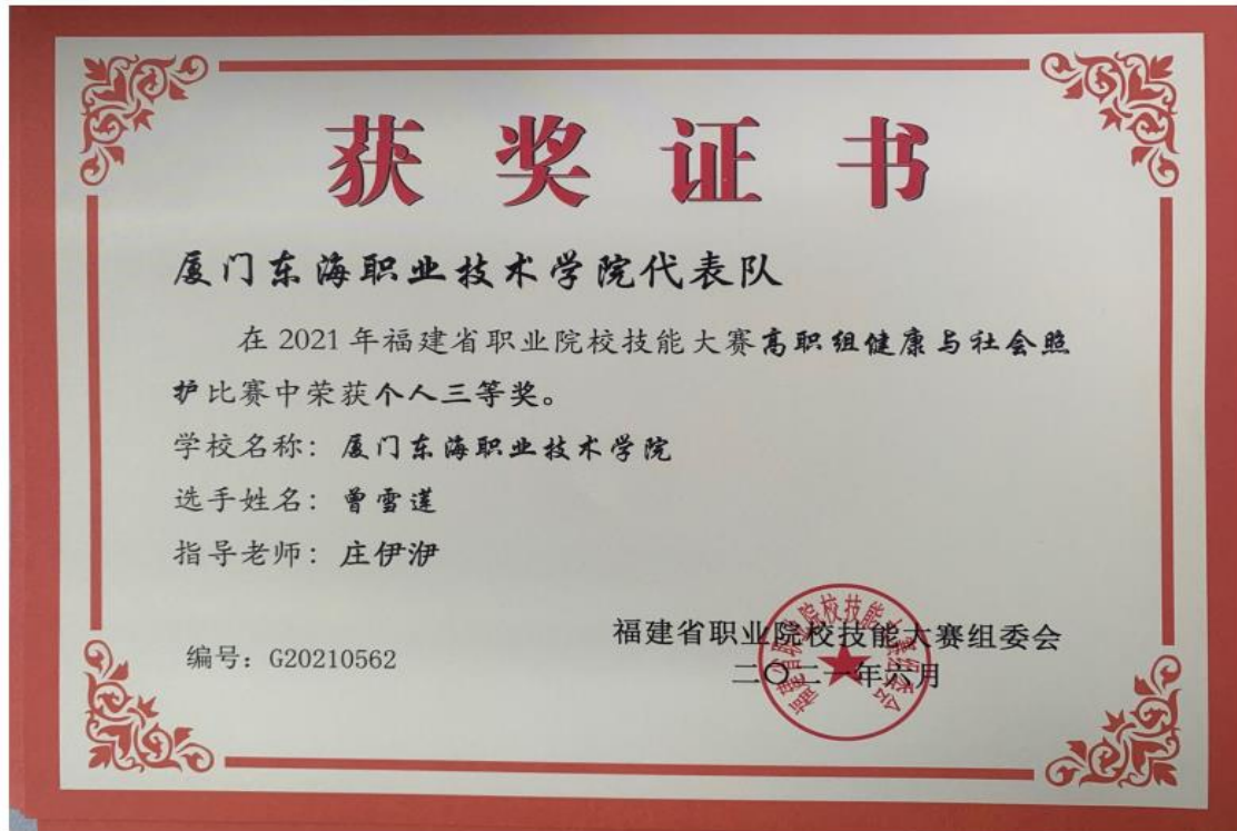
图 14：曾雪莲同学荣获 2021 年福建省技能大赛高职组健康与社会照护个人三等奖