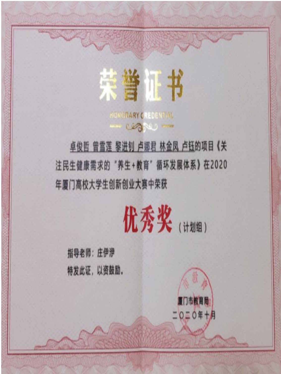
图 18：关注民生健康需求的“养生+教育”循环发展体系项目荣获厦门高校大学生创新创业大赛优秀奖