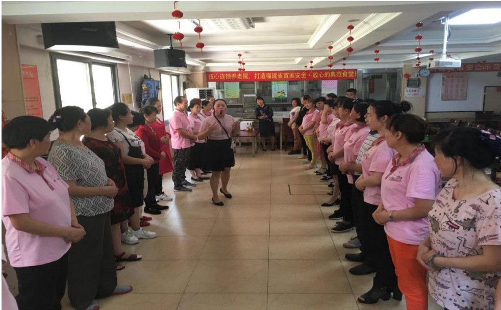
图 10：服务礼仪团体培训授课现场