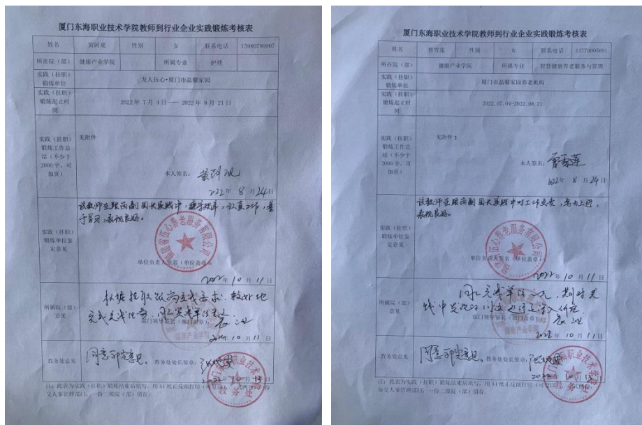
图 7: 黄阿观、曾雪莲两位教师到企业（挂职）锻炼考核表

2022年暑期健康产业学院派黄阿观、曾雪莲2位教师到龙人伍心·厦门市温馨家园副园长岗跟岗实践，实践时间为2022年7月4日—2022年8月21日，共7周，时间内容主要是了解副园长的一日工作和主要的职责。2位老师在实践期间主动关爱老人，了解老人的需求，虚心向养老院学习专业知识获得一致的好评。