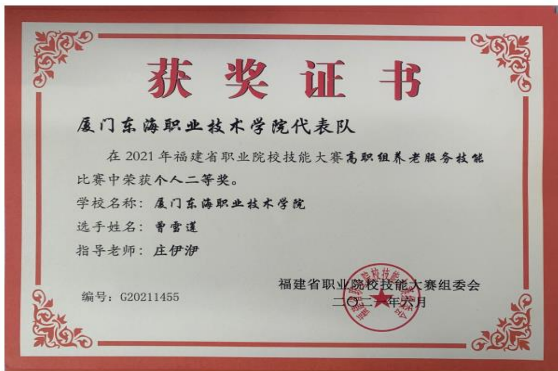
图 13：曾雪莲同学荣获 2021 年福建省技能大赛高职组养老服务技能个人二等奖

2022年，学校校企合作实践共融课程——拓宽智慧助老教育培训的项目获批福建省第二批“智慧助老”教学培训项目推介名单之一，排名第3名。