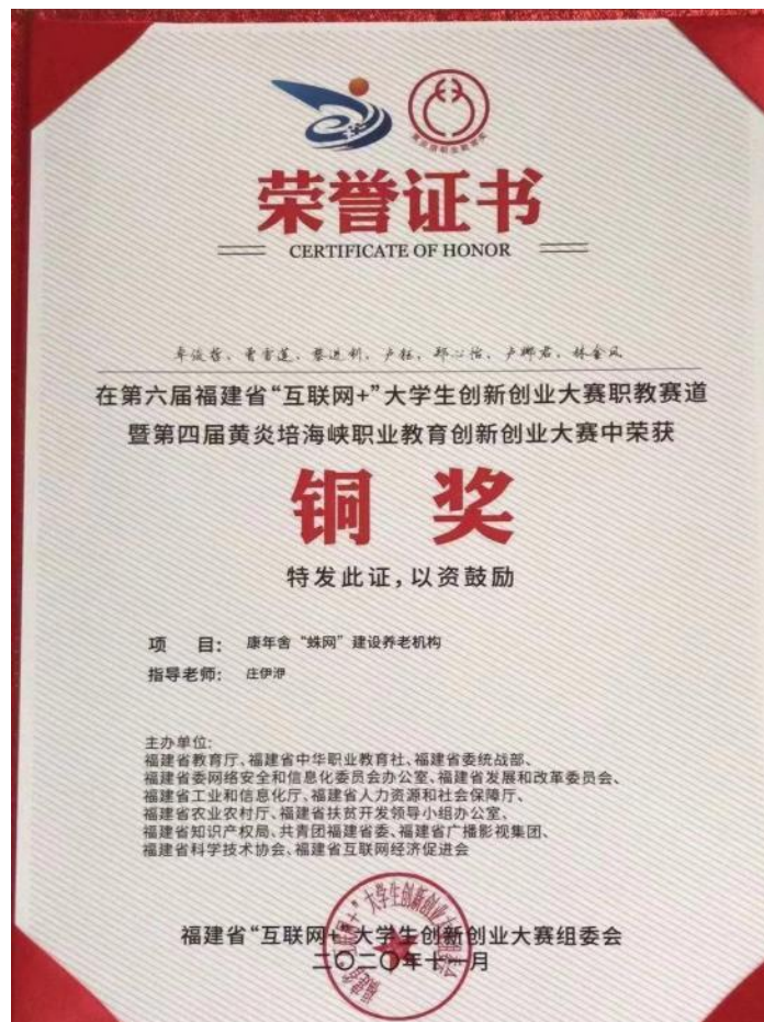
图 17：康年舍“蛛网”建设养老机构项目荣获福建省“互联网+”大学生创新创业大赛铜奖