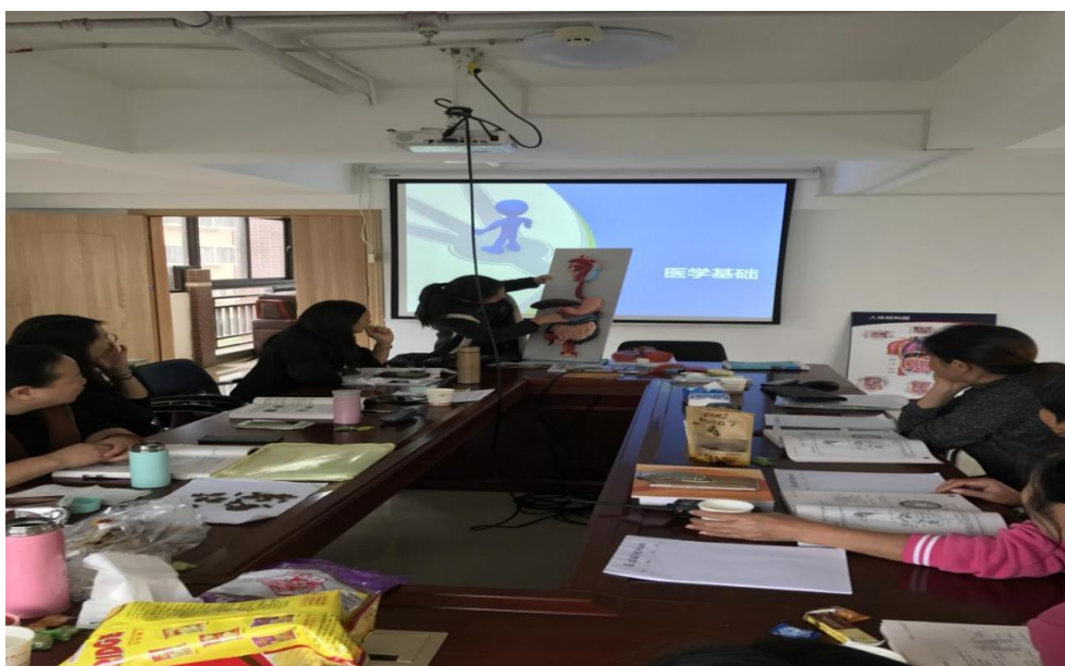
图9：《基础医学》授课现场

依托超星慕课线上课程+后期线下+企业技能实践，常规年度均能完成了学业线上课程7门、企业技能课程1门，学校送课进企课程3门的工作。