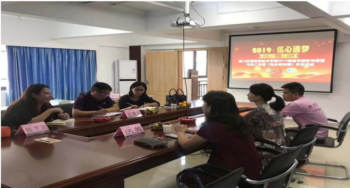
图 1：学校与伍心养老院校企合作双方座谈会

学校与龙人·伍心家园总院厦门温馨家园养老中心、安溪明爱养老福利院（分院）于 2018 年 6 月获批福建省教育厅实施“二元制”技术技能人才培养模式改革试点的专业，课程教育都在顺利开展。2019 年新增南安市龙人伍心家园福利养老院（分院）、华安县龙人伍心养老服务有限责任公司（分院）共同申请。专业在二元制人才培养模式改革上具有一定的基础。而且也是厦门市唯一的、第一个申请现代学徒制试点的专业，并于 2020 年、2021 年均通过验收。